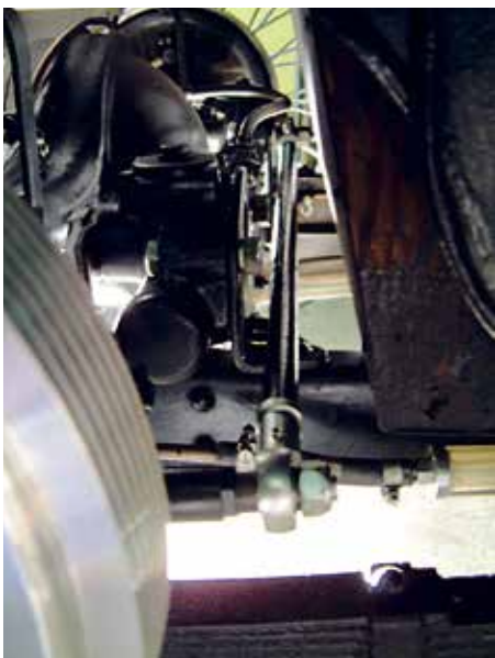
MG TC, Panhardstab parallel zur Hinterachse mit Blattfedern