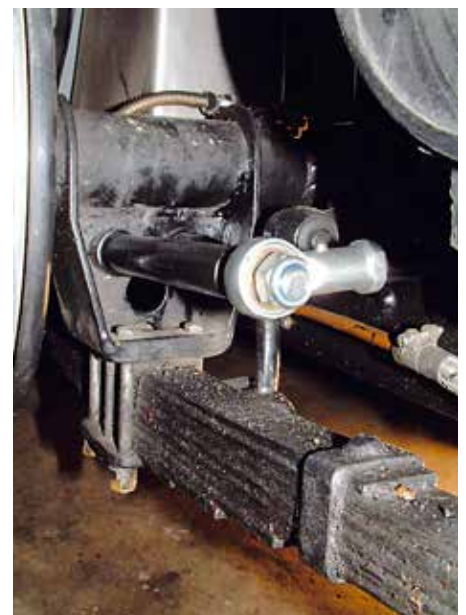
MG TC, Befestigung auf der linken Radseite an der Achse

Warum erzähle ich das wo doch die meisten Engländer keinen haben? Man kann diese Innovation in vielen Fällen nachrüsten und verbessert damit das